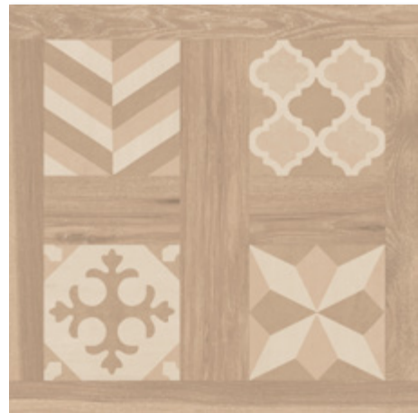
SELANDIA DECOR MIELE