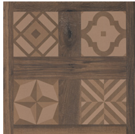
SELANDIA DECOR EBANO