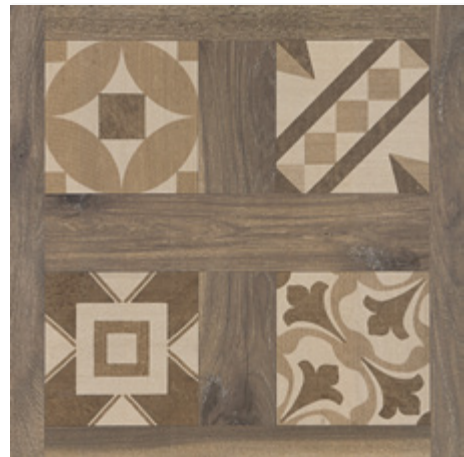
SELANDIA DECOR NOCE