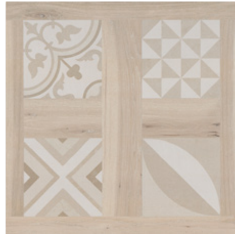
SELANDIA DECOR HAYA