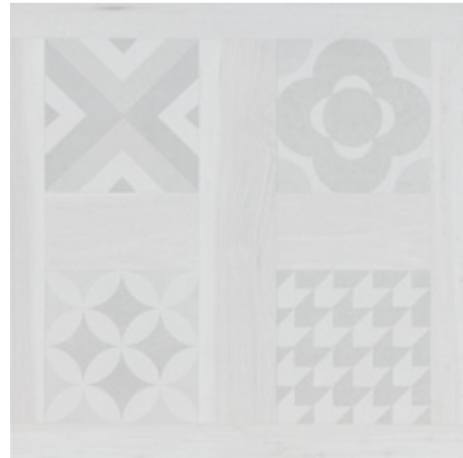
SELANDIA DECOR BIANCO