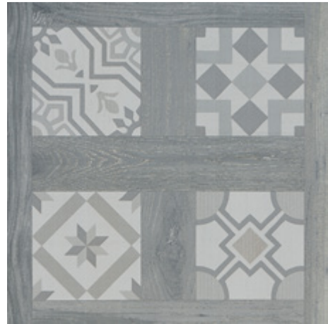
SELANDIA DECOR FUMO